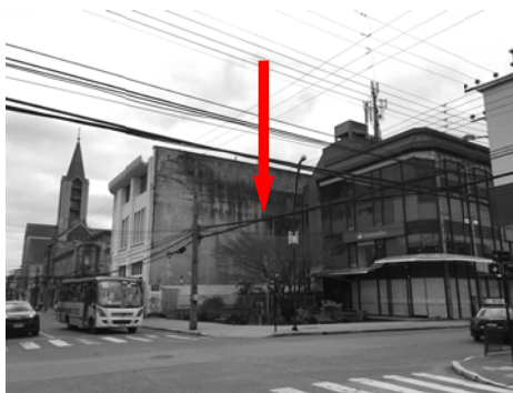
Imagen 1: Fachada sur edificio Maipú

El mural será emplazado en la fachada sur del “Edificio Maipú” (ver imagen 1), y debe sumar un área máxima aproximada de 60m 2 pintados (ver imagen 2). De libre disposición en el área indicada con la letra B en el punto 4 de las bases. La creatividad del diseño es lo más importante por sobre las superficies.